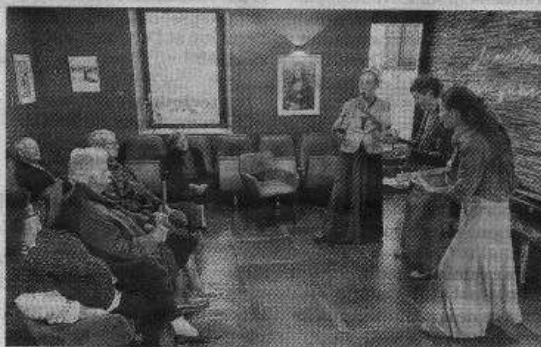
Le trio de musiciennes en démonstration.

Ensuite, elles ont fait escale à Bruley.