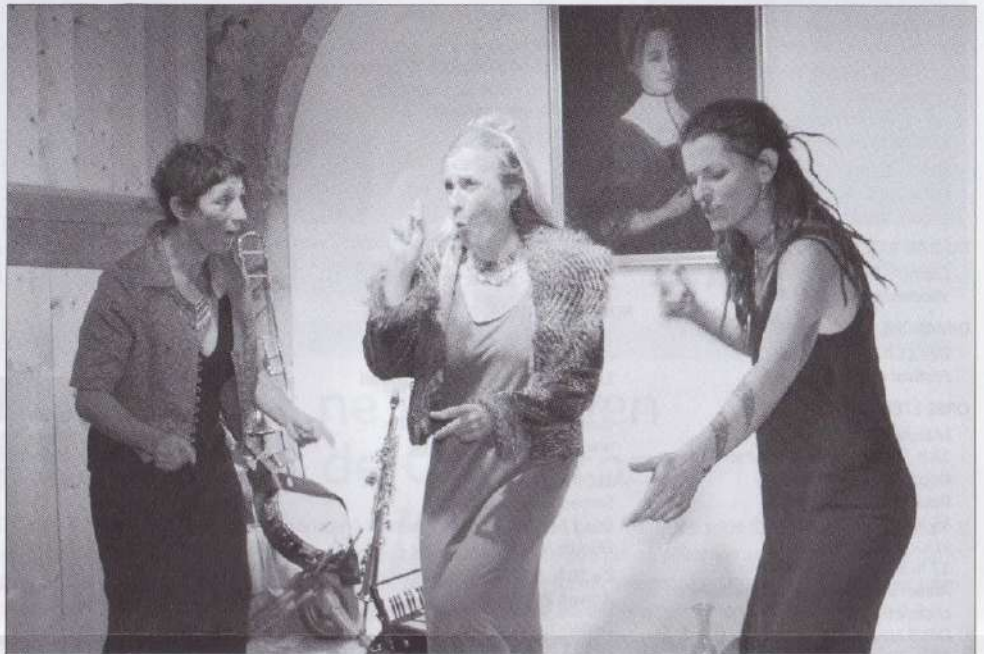
Les Souricieuses, trois femmes de France voisine qui aiment la vie, les gens et qui le démontrent avec talent et énergie.

Panaïs, Raves et Salsifis, une association à suivre et à encourager impérativement: www.panaïs-raves-salsifis.ch